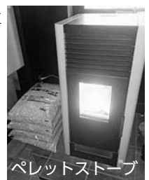
ペレットストーブ

◆問合せ先／県地球温暖化防止活動推進センター ☎023-679-3340 役場住民税務課生活環境室 ☎87-0514