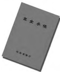
年金証書と年金手張はそのまま使えます