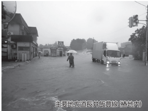
主要地方道長井飯豊線(椿地内)