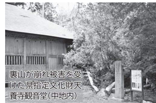
裏山が崩れ被害を受けた県指定文化財天養寺観音堂（中地内）