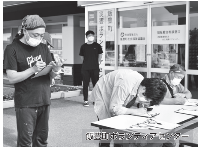
飯豊町ボランティアセンター