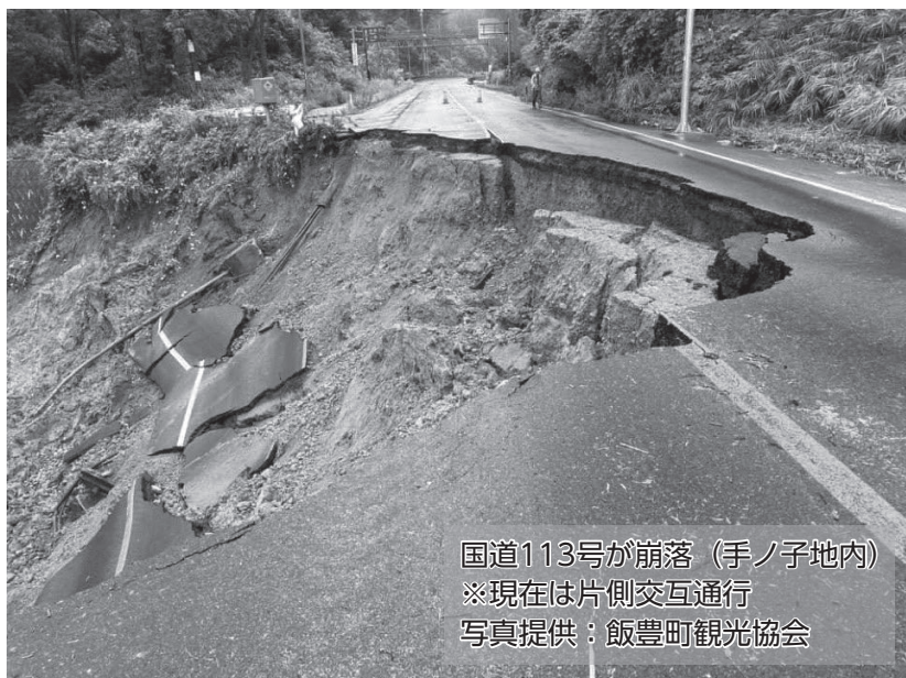
国道113号が崩落（手ノ子地内） ※現在は片側交互通行