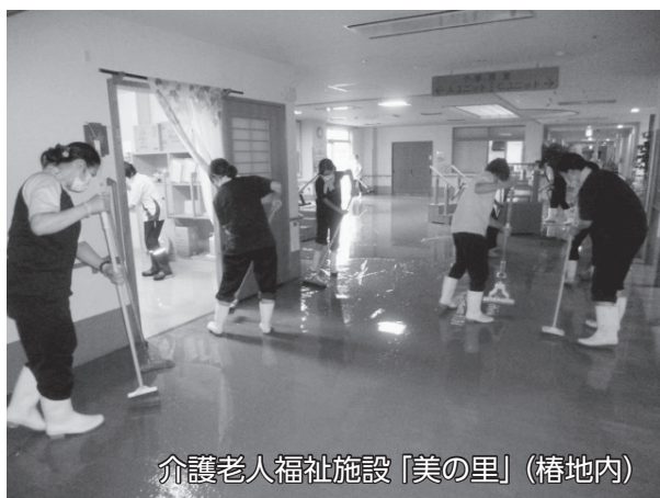
介護老人福祉施設「美の里」(椿地内)