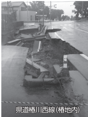
県道椿川西線(椿地内)