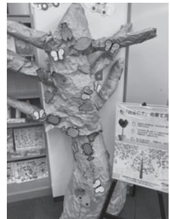
読書の木はおすすめの本が書かれた 葉っぱカードや昆虫カードでいっぱいになりました