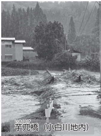
いちはら市 芋元橋 (小白川地内)