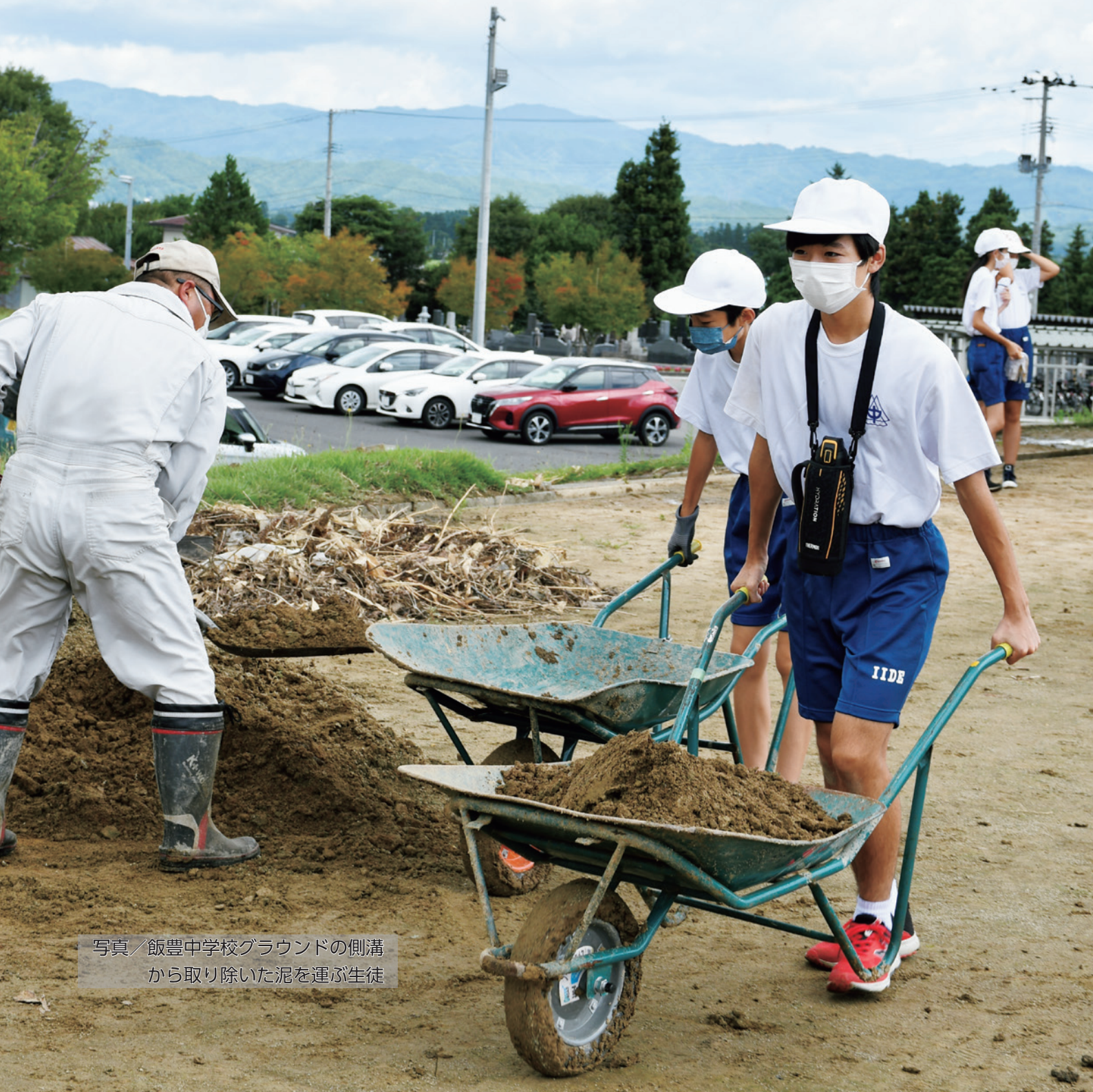
写真／飯豊中学校グラウンドの側溝 から取り除いた泥を運ぶ生徒