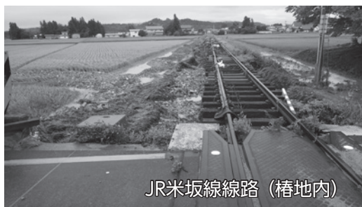
JR米坂線線路（樺地内）