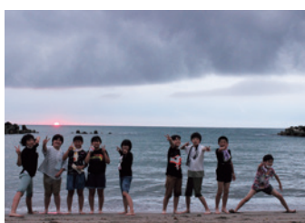
ごみ拾いをきれいになった砂浜で、夕陽とともに

今回は第二小学校と手ノ子小学校のSDGsの取り組みを取材しました。現在は、学校の教育過程にもSDGsが組み込まれています。今回はその中でも小学校独自で実施した特徴的な取り組みについて紹介します。