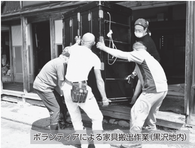
ボランティアによる家具搬出作業(黒沢地内)