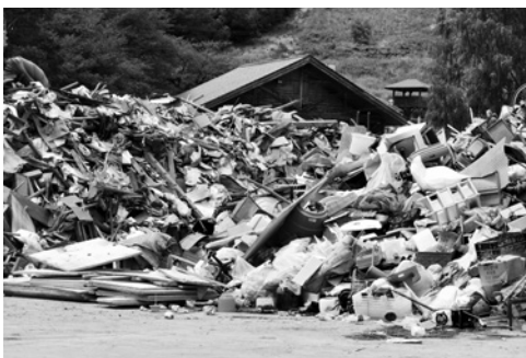
り災ごみ仮置場に搬入されたりり災ごみ