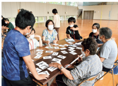
漢字作りゲームを通して地域の皆さんと交流

「第二小学校の取り組み」 山形県内でのSDGs修学旅行 飯豊町がSDGs教育へ力を入れてのことから、県内で修学旅行を通じSDGs学習につなげることはできないかと考え、SDGs修学旅行を企画しました。 これまでにGoal7（エネルギーをみんなにそしてクリーンに）の学習では、県内の水力発電や風力発電の見学、Goal14（海の豊かさを守ろう）の学習では、海辺のごみ拾いや現地・最上川中流、地元白川での調査を実施し、その学びを学習発表会で報告しました。 これらの活動を通じ、子供たちは普段の行動をSDGsとつなげて考えられるようになってきています。 今年度はSDGsの学習が深まってきたため、修学旅行だけでなく、個別にテーマをもって活動し、より深くSDGsを学んでもらおうと計画しています。