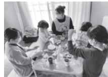
カフェで家族交流する様子

女性スタッフが対応してくれる安心感と、友人の家に遊びに来たような親近感でホッとします。ここで知り合い、他の交流事業で仲良くなってつながっていく。子どもも大人も、人とのふれあいやつながりがあって安心して暮らしていけることを実感する、温かい居場所です。