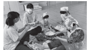
多世代が集まり 笹巻きづくりに挑戦