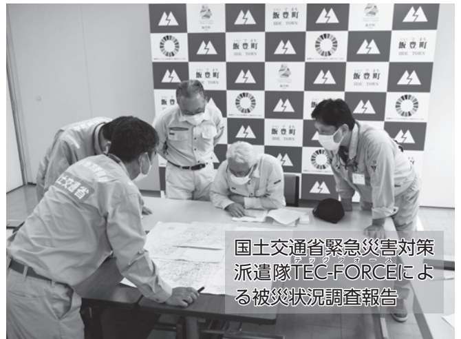
国土交通省緊急災害対策派遣隊ITC-FORCEによる被災状況調査報告