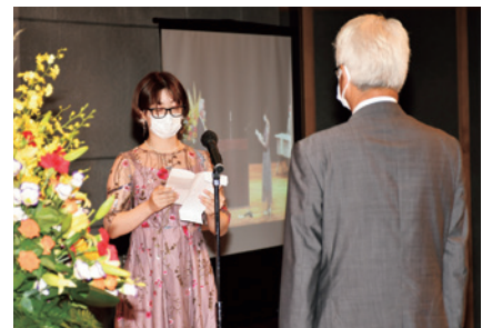
宣誓する成人代表