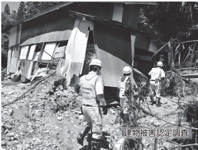
建物被害認定調査