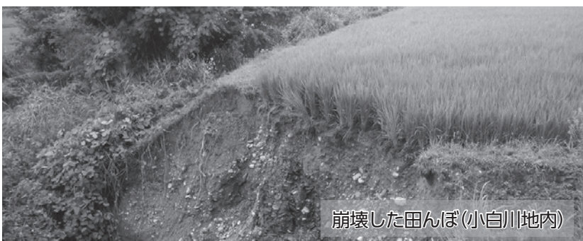
崩壊した田んぼ（小白川地内）