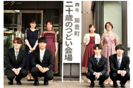
二十歳のつどい実行委員の皆さん