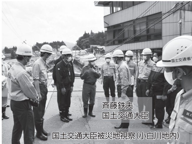
斉藤鉄夫 国土交通大臣