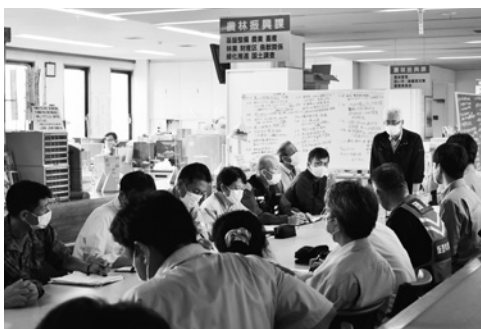
飯豊町災害対策本部会議の様子