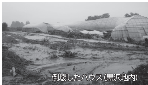
倒壊したハウス（黒沢地内）