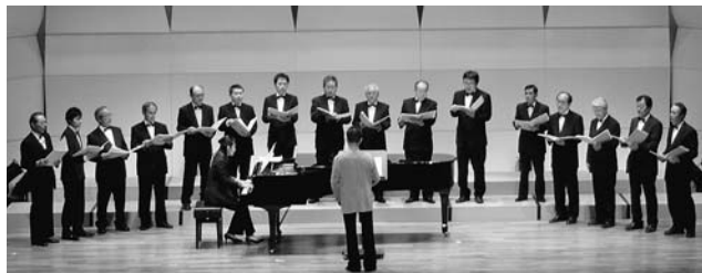
▲合唱を披露する男声合唱団「プロージット」