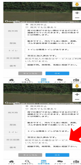
入力完了後「OK」を押す