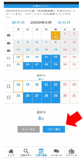
コピーで複数の日の募集