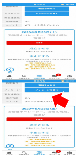
「成立させる」を押す