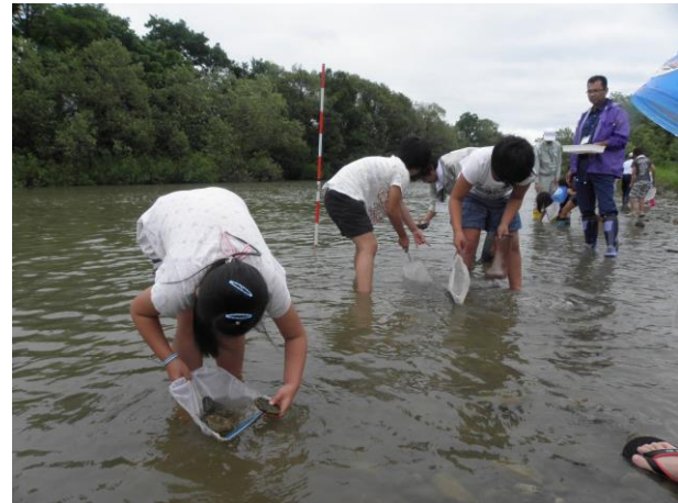
協力して、水生生物を探しています。 たくさん見つけれられるかな～？