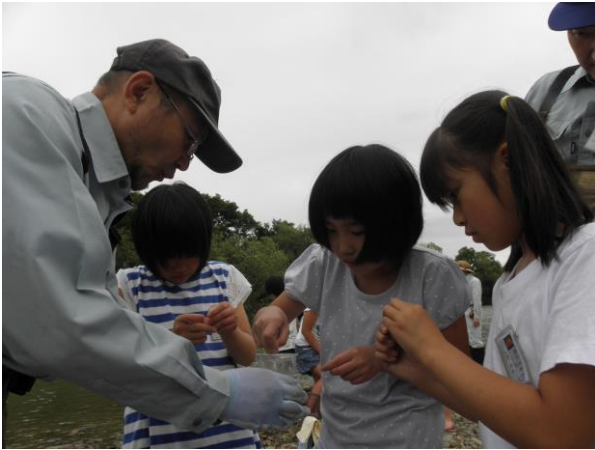
◆パックテスト（PH） 数値は、6～7中性でした。