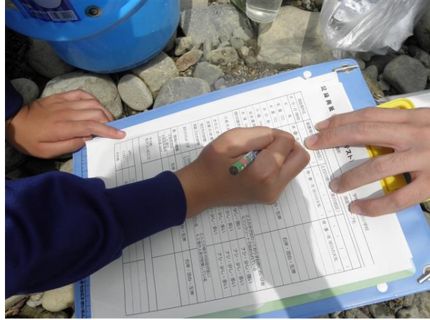
結果を記録用紙に記入しています。