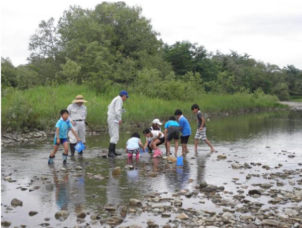
◆水生生物調査 石を動かし、石の下にいる虫を調査します。