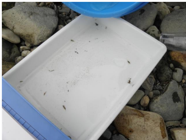
たくさんの水生生物が見つかりました。