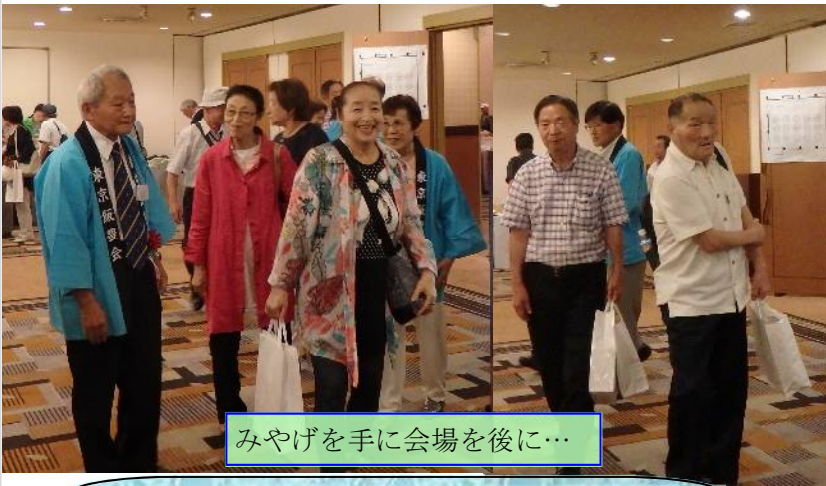
みやげを手に会場を後に…