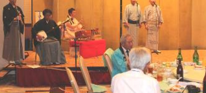
第52回総会より 民謡東流芳永会