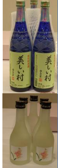
お酒も売ってます・うちに帰って楽しんで