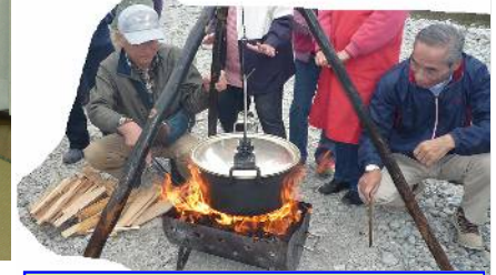
火遊びはいつの世もワクワク?