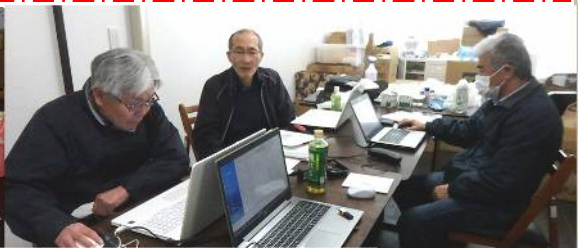
部屋に缶詰め状態の日々が続く