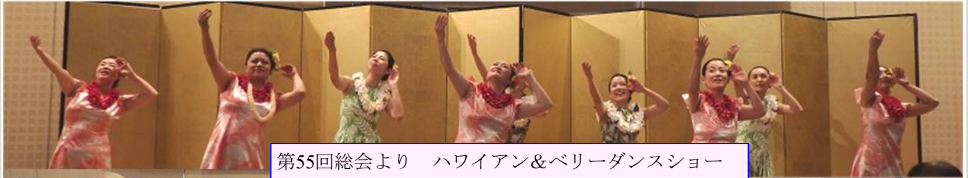
第55回総会より ハワイアン&ベリーダンスショー