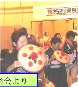
思い出話と 抽選会風景