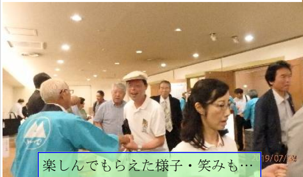
楽しんでもらえた様子・笑みも…