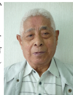
ご冥福をお祈り致します