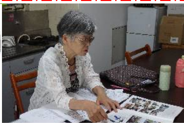
広報部員・会報編集作業