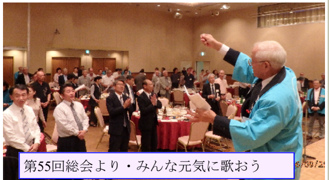
第55回総会より・みんな元気に歌おう