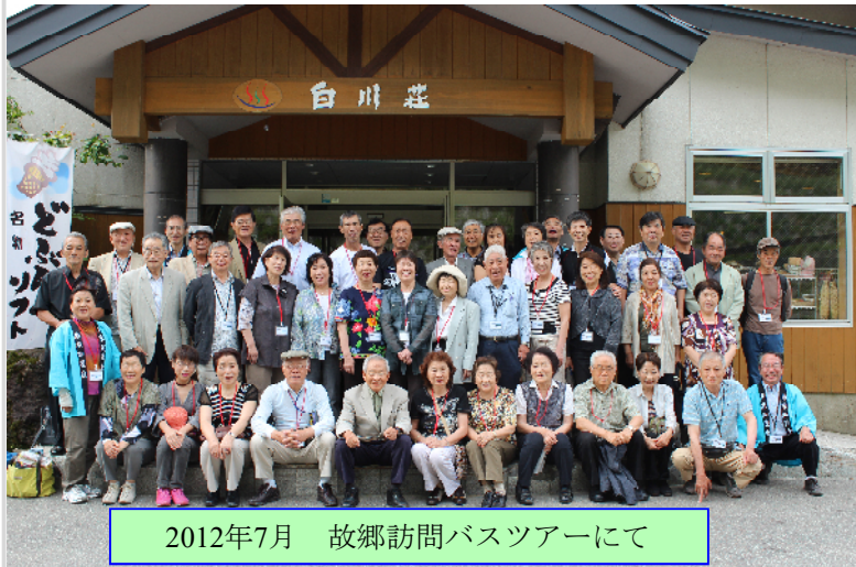
2012年7月 故郷訪問バスツアーにて