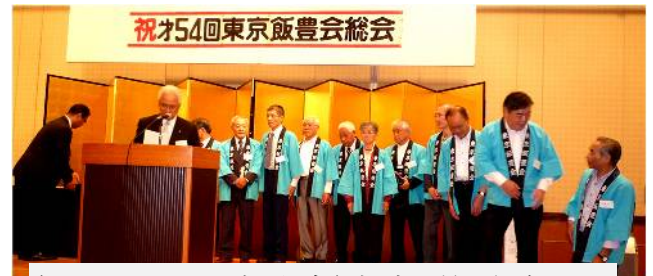
観光コンシェルジュ任命伝授式風景・総会から

結びに、東京飯豊会の益々のご発展と、会員の皆様のご健勝とご活躍を心からお祈り申し上げます。