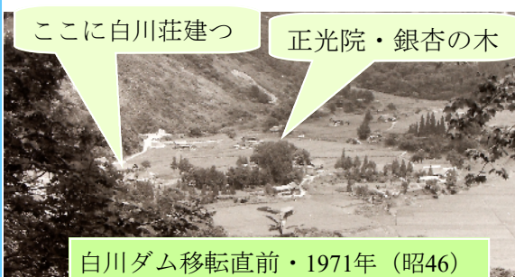
ここに白川荘建つ 正光院・銀杏の木 白川ダム移転直前・1971年(昭46)