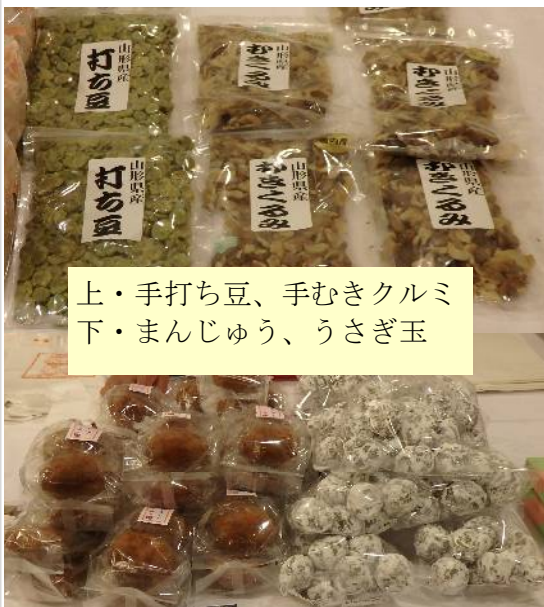
上・手打ち豆、手むきクルミ 下・まんじゅう、うさぎ玉