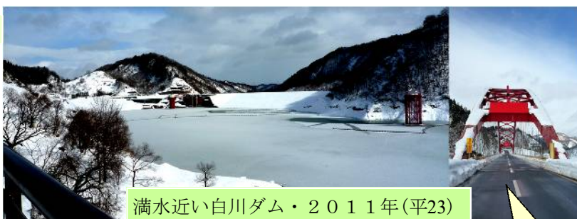
満水近い白川ダム・2011年(平23)