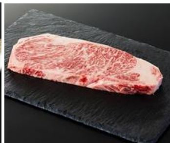
ステーキ用 (一人前)