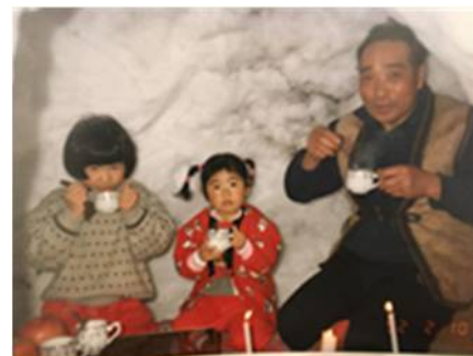
お孫さんとかまくらで…

オニヤンマが悠然と飛んでいる小川では「縄張りがあるから同じところを行ったり来たりするんだ」「天の川、はつきり見えるでしょ！」勉強は苦手な「じいじ」だけどそのようなことは教えてあげられるよ。ずっと覚えていられるかな？また機会があれば連れて行くよ。「帰れる場所があるから」…。