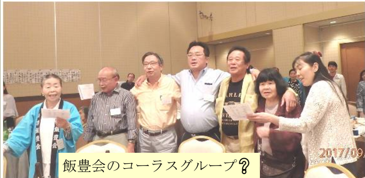
飯豊会のコーラスグループ?