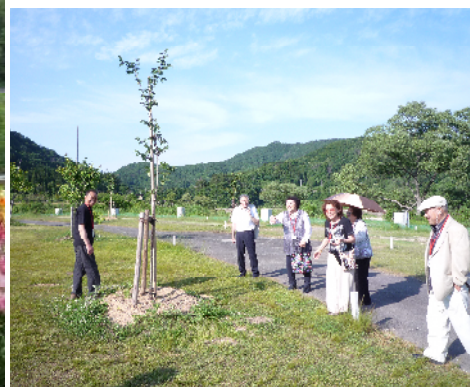
桜植樹を視察・10年後はここにゴザを敷いて昔話にも花咲かせよう（スワンパークにて）