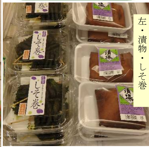
右・青きな粉 左・漬物・しそ巻