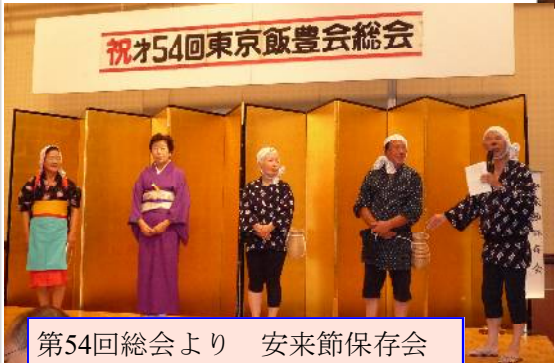
第54回総会より 安来節保存会