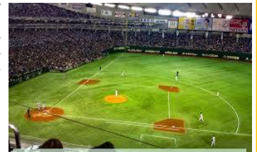
宣言解除が待ちどろしい

早くコロナが終息宣言して元の生活に戻りたいと思っています。オリンピック開催が危ぶまれている今日この頃ですが!!、皆さんコロナに負けないで頑張ってください!!。