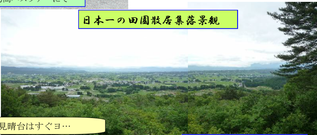
見晴台・胸いっぱい吸って～