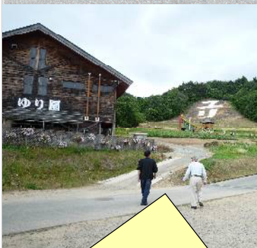
ユリ園にて・坂を登れば見晴台はすぐヨ…