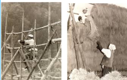
はせ吊りと稲な上げ・昭和46年