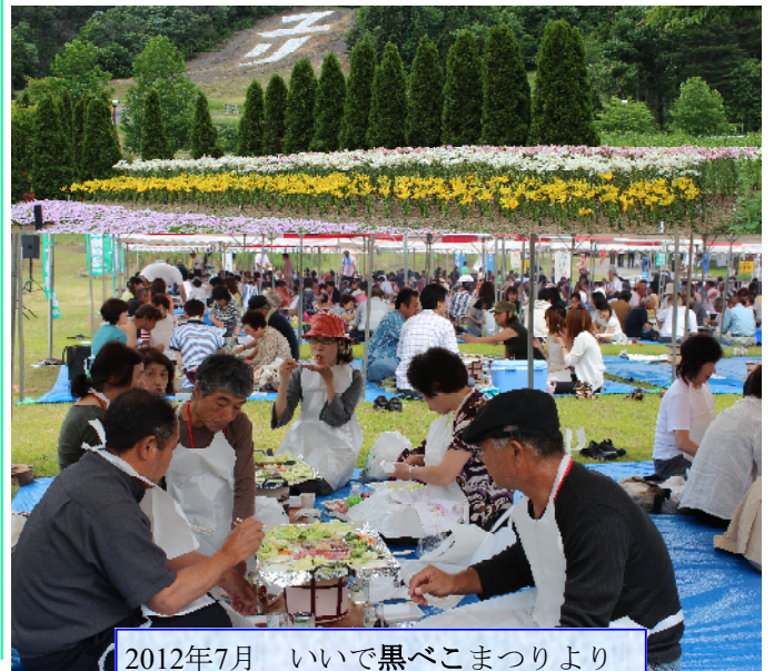
2012年7月 いいで黒べこまつりより

結びになりますが、東京飯豊会のますますのご発展と会員各位のご健勝を心よりご祈念申し上げますとともに、引き続き飯豊町観光事業へのご支援、ご指導を賜りますようお願い申し上げますお祝いの言葉といたします。