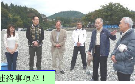
進行と安全確認・連絡事項が!