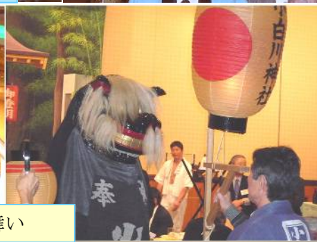
第50回総会より 小白川神社・獅子連舞い