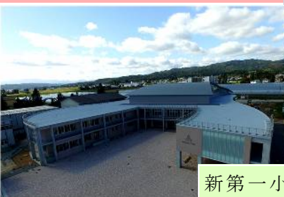
新第一小学校校舎