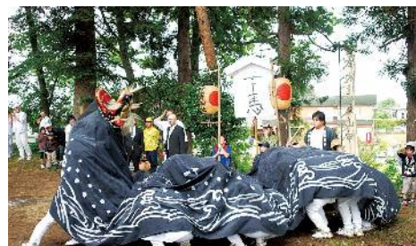
昭和30年代子供の頃は楽しみの一つ