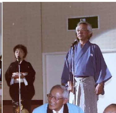
第46回総会より 井上光雲翔会民謡会