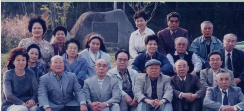
30周年記念・故郷訪問バスツアー白川湖畔にて（1991年5月）