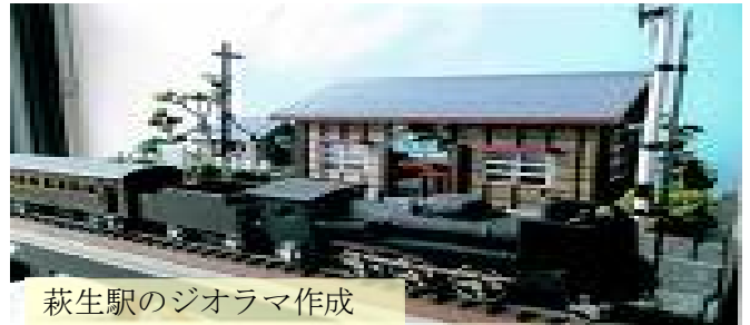
萩生駅のジオラマ作成

定年後は大の撮り鉄ファンとして主に東日本鉄道の現役SLの勇姿を撮りまくり、自宅ではNゲージの模型作りをボケ防止を兼ね趣味として楽しんでおります。この自作の想い出の萩生駅はそのイメージで造った物であるが、作品をボンヤリと眺めていると、石炭のニオイ・汽笛の音・切れの良い蒸気音と共に多くの人達の間人ドラマと飯豊町の歴史をこの米坂線が教えてくれる様な、そんな懐かしさを覚える今日この頃です。