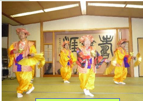
大黒舞い保存会（2012.7月）