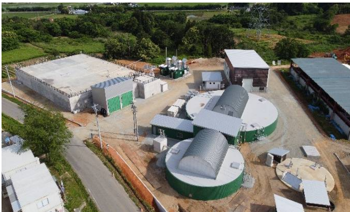
発電所全体図

※1. 2015年の国連サミットで採択された「持続可能な開発のための2030アジェンダ」に記載された、2016年から2030年までの国際目標