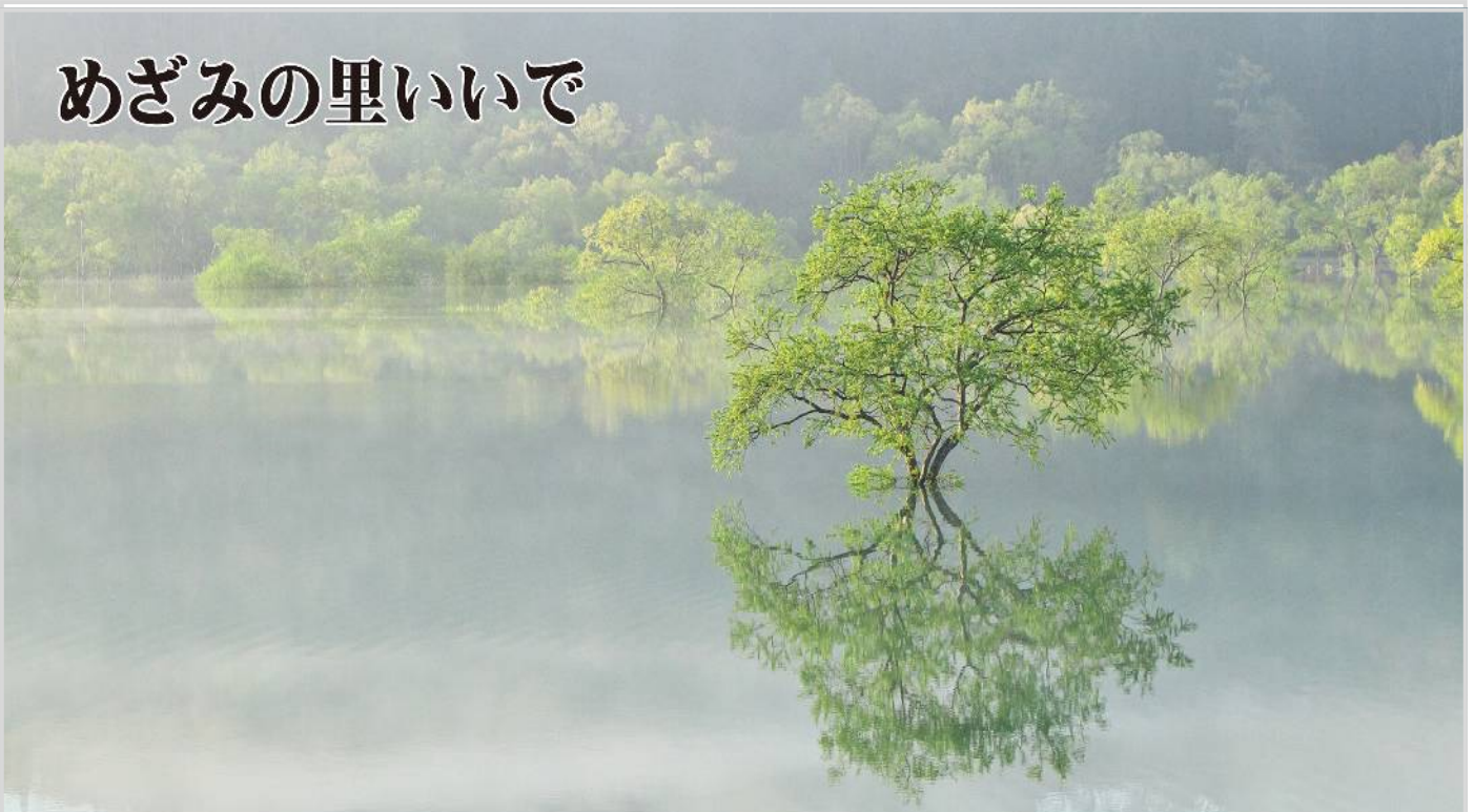
写真: 白川湖の水没林

白川ダム上流の白川湖は春先より雪解け水が流れ込み満水の時期を迎えると新緑のシロヤナギが水につかります。4月中旬頃に姿をみせる水没林は田植えが始まる1ヶ月後には一気に放流され姿を消してしまいます。季節的に湖面に朝もやがかかりやすい時期でもあり、条件が揃えばより幻想的な表情を見ることができます。