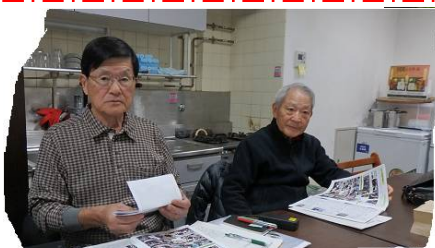
陣中見舞に会長が...