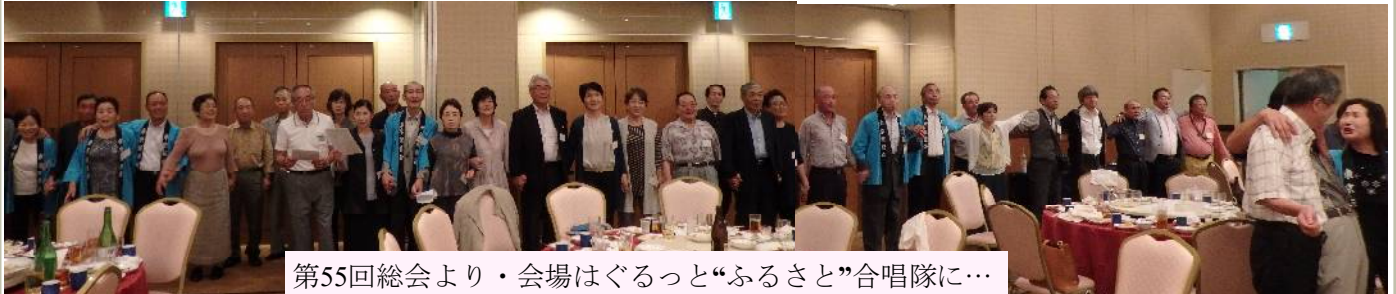
第55回総会より・会場はぐるっと“ふるさと”合唱隊に…