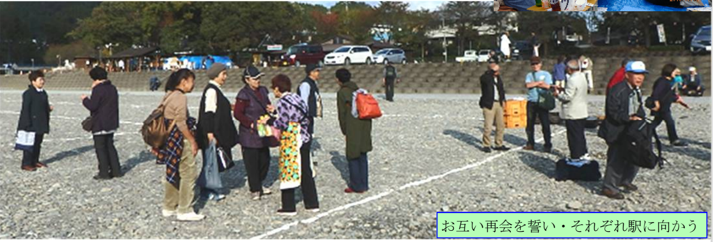
お互い再会を誓い・それぞれ駅に向かう