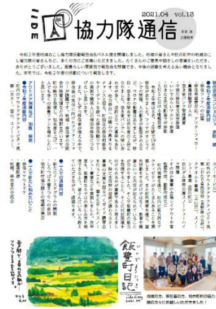
広報いいで令和3年4月号

地域おこし協力隊の先輩である家財さんとともに、「広報いいで」でコラムを連載しています。特技を生かしたイラストでページを彩り、町の魅力を発信します。