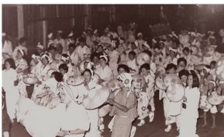
部落対抗盆踊り・昭和46年