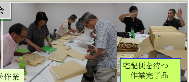
宅配便を待つ作業完了品