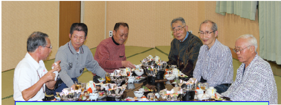
第2回芋煮会写真より・前泊して芋煮会の下準備・ご苦労様です!!