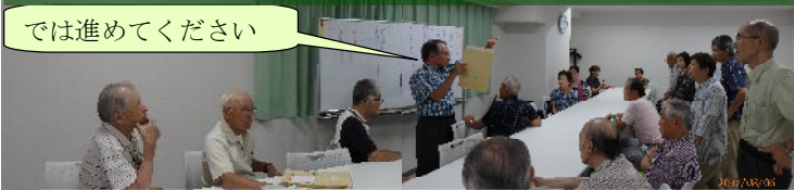
2017年8月 役員会から・会員の皆様へ案内状の発送作業