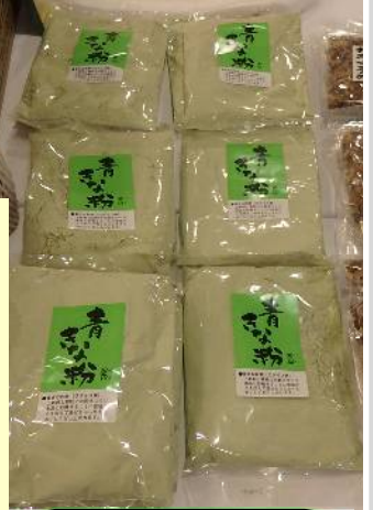
会場で即売会 (めざまの里) 第56回総会より