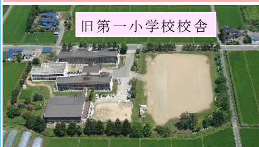
旧第一小学校校舎